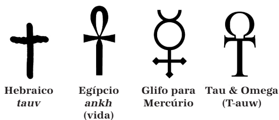
Imagem do Autor

O Egípcio ankh , que significa vida, estava intimamente associado com Thoth. O antigo grifo de cruz com círculo de Mercúrio e a combinação das letras Gregas (a consoante tau e a vogal ómega), formavam a palavra t-auw , com significado vagamente parecido. Ambos estão relacionados com a marca de tauw de Caim, como o símbolo que “preservou a sua vida”.